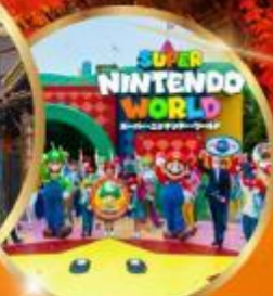
อิสระ: UNIVERSAL STUDIO