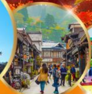
ทาคายาม่า